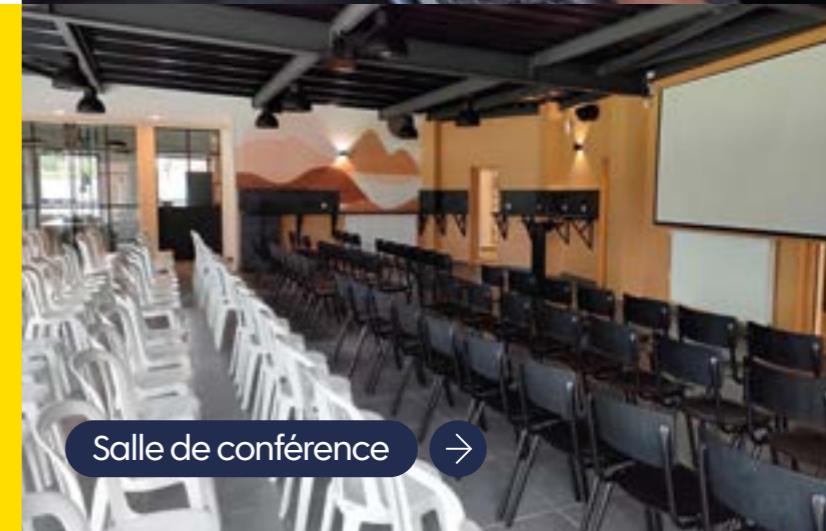
Salle de conférence →