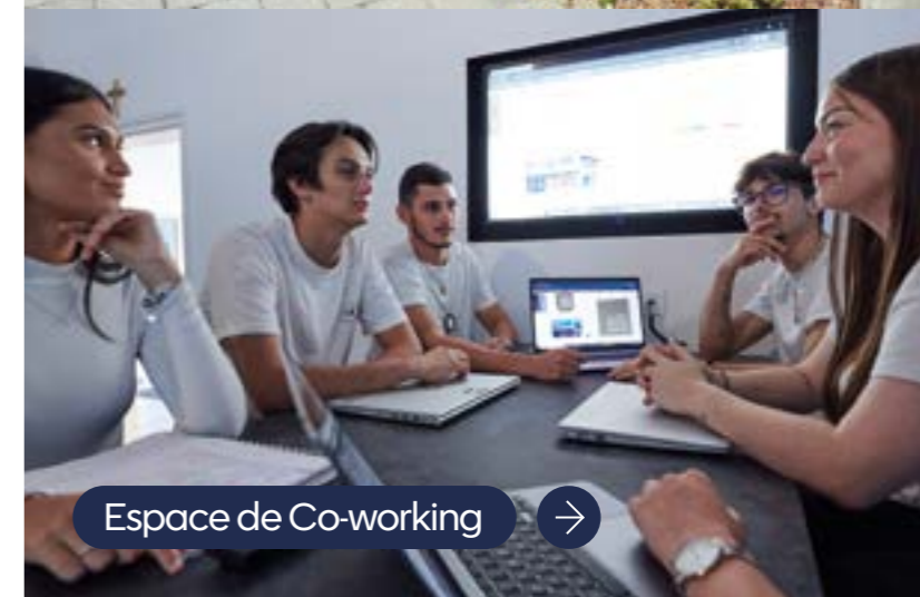
Espace de Co-working →