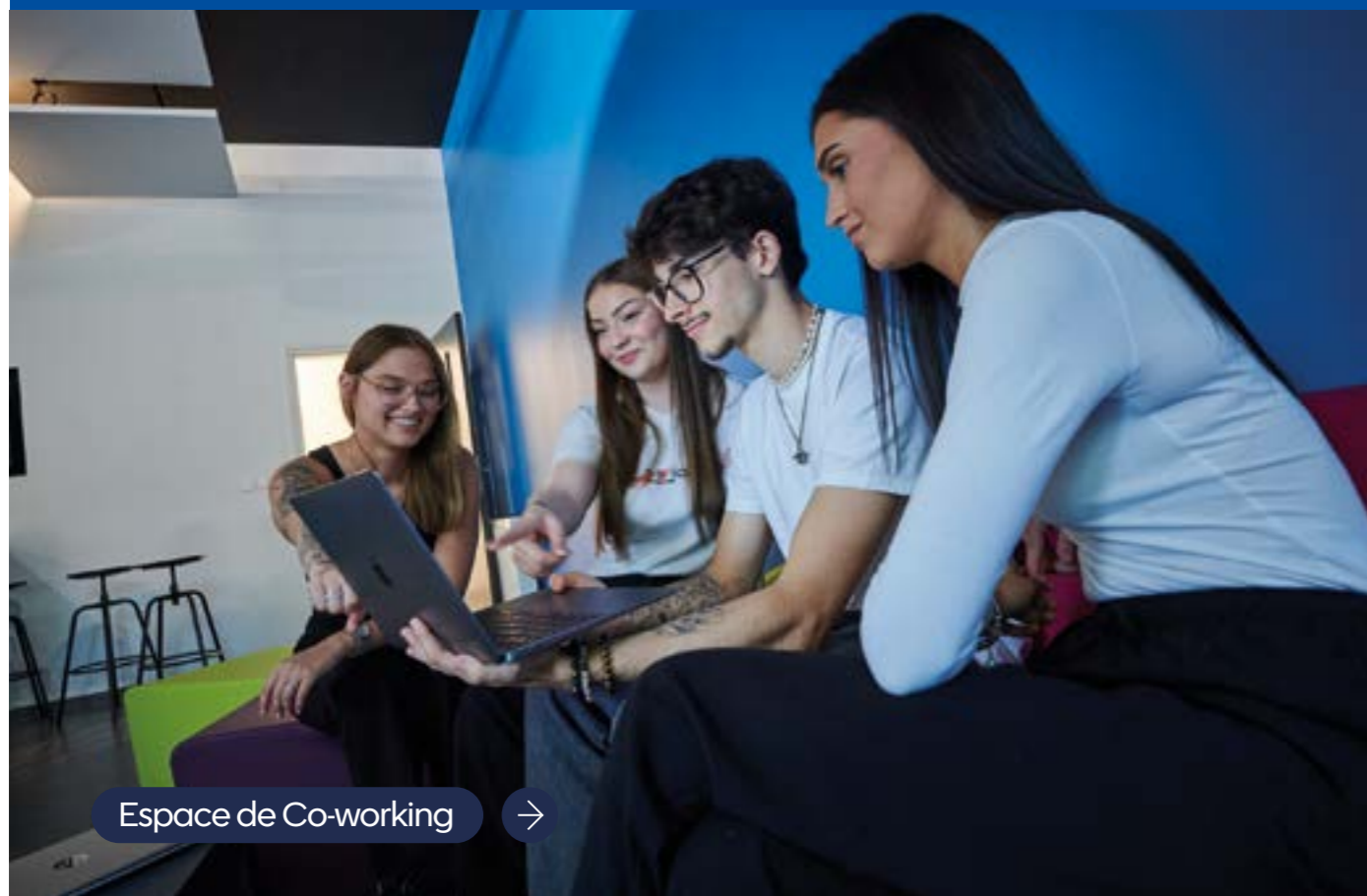
Espace de Co-working →