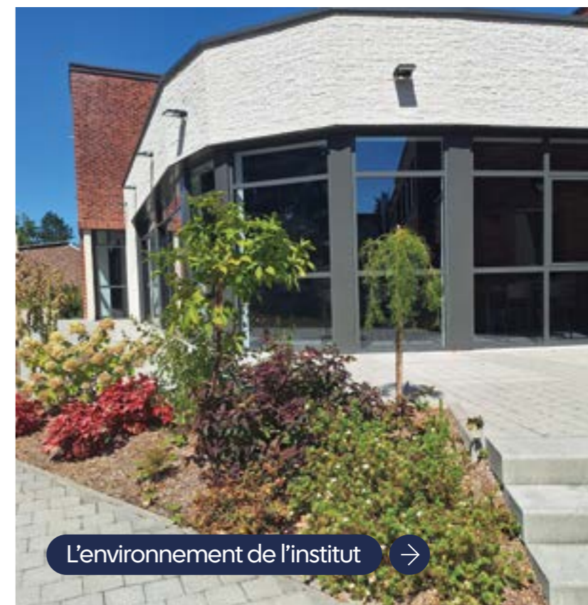
L'environnement de l'institut →